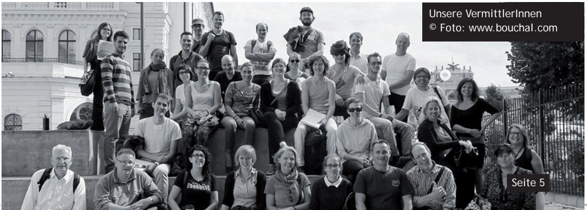
Unsere VermittlerInnen

Welche Mechanismen trugen zur enormen Anhängerschaft der Nationalsozialisten bei? Welche Motive für zivilen Mut gab es in einer Zeit, in der die Mehrheit angepasst lebte? Der Rundgang erzählt die Geschichte des Nationalsozialismus in Wien an Orten des Geschehens und soll Jugendliche für ein „Nie Wieder“ sensibilisieren.